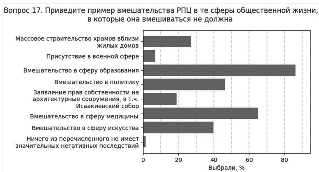
Ил. 5. Мнение опрошенных о претензиях в адрес Русской Православной Церкви

Опрошенные активно поддерживают часто высказываемые претензии на чрезмерное вмешательство РПЦ в жизнь общества и государства: 86% считают таковым вмешательство в сферу образования, 65% — в сферу медицины, при этом лишь 24% — массовое строительство храмов. Последнее особенно показательно, учитывая значительный процент активистов движения «Торфянка»: осязаемые, бытовые столкновения с Церковью «рядом с домом» свободомыслящие считают менее важными, чем конфликты в сфере медицины и образования.