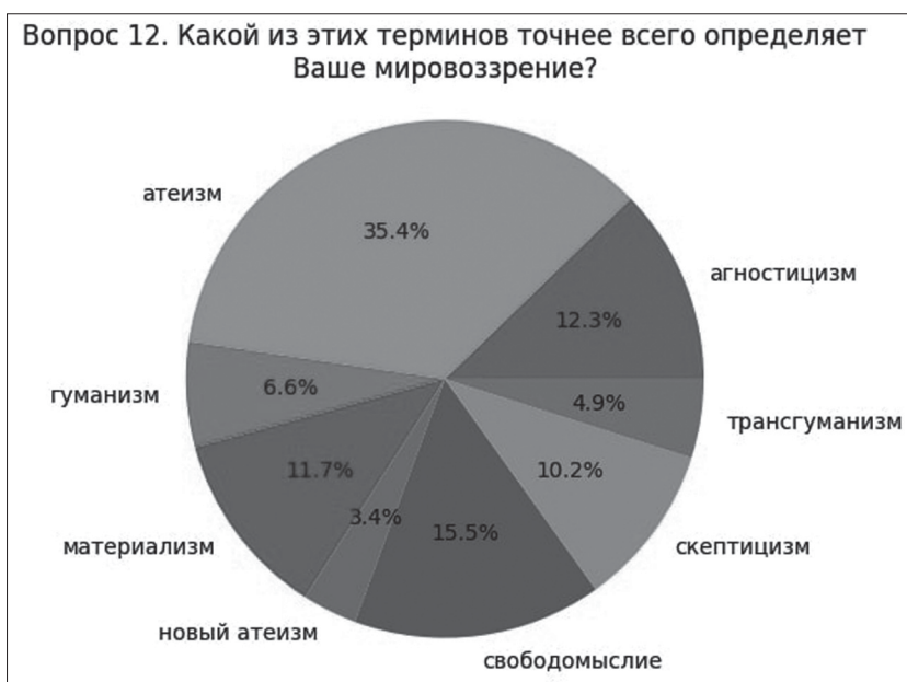
Ил. 1. Распределение самоидентификации опрошенных

Важно подчеркнуть, что у опрошенных отношение к Богу по большей части совпадает с самоидентификацией (см. табл. 1). В основном респонденты определяют себя как атеистов (35,4%) и скептиков (10,2%), однако 15,5% идентифицируют себя со «свободомыслящими». При этом 61% респондентов не верит в Бога («Бога не существует / не верю, что он есть»), 20,2% считают, что «у нас недостаточно данных, чтобы говорить о его существовании». В сообществах свободомыслящих немногим больше трансгуманистов, чем в общей выборке, и несколько меньше атеистов, на 5%. Организованные свободомыслящие чаще выбирают ответ: «у нас недостаточно данных, чтобы говорить о существовании [Бога]» — 24,7%. Такой ответ чаще выбирают те, кто идентифицировал себя как агностики (29,7%), скептики (18,9%), свободомыслящие (16,2%). Очевидно, что респондентам сложно разграничивать агностицизм и скептицизм.