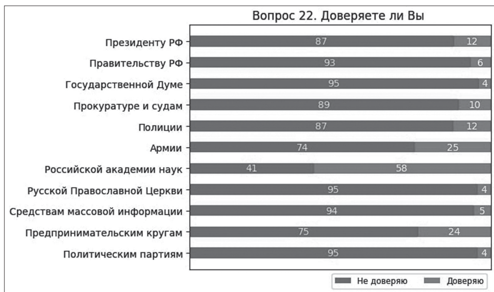
Ил. 3. Рейтинги доверия и недоверия опрошенными различными институтами

Одним из наиболее важных в опросе является кластер вопросов, посвященных отношению опрошиваемых к религии и религиозным организациям.