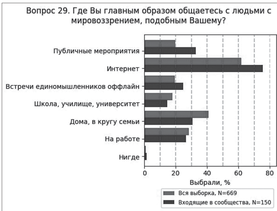
Ил. 6. Способы общения свободомыслящих, входящих и не входящих в организации

большие материалы, и значительная часть тех, кто дискутирует в группах, относят себя к организованным. Это косвенно подтверждает гипотезу о том, что организованное свободомыслие существует в настоящее время главным образом в интернете.