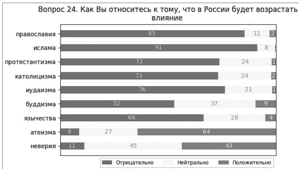
Ил. 4. Отношение опрошенных к распространению влияния различных конфессий и мировоззрений

К распространению атеизма опрошенные относятся ожидаемо лучше, хотя нельзя говорить о единодушной поддержке: лишь 65% одобряют, если влияние атеизма в стране будет расти. При этом еще более сдержанно они поддерживают неверие (менее 50%). Это может быть обусловлено тем, что атеизм кажется им термином более понятным для выстраивания собственной идентичности, а «неверие» некоторые опрошенные связывают с мировоззренческим или моральным нигилизмом.